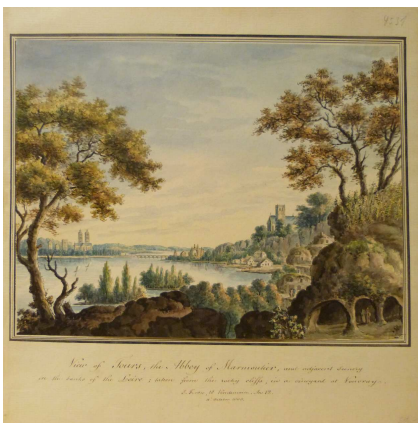
James Forbes : Vue de Tours, de l'Abbaye de Marmoutiers et de ses environs. 1803.

Leur aide à l'acquisition de l'Horloge de table triangulaire de David Le Roy en 1987, des Anges musiciens de Lorenzo Veneziano en 1998, de fauteuils de Chanteloup en 2007 et des trois Batailles de Richelieu en 2010, à la réalisation de catalogues d'expositions, à l'invitation régulière de conférenciers, à l'organisation d'Apéritivi... révèlent cet intérêt constant des Amis à la vie et à l'enrichissement du Musée et de la Bibliothèque.