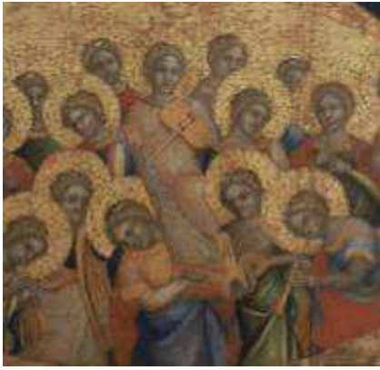
Lorenzo Veneziano : Les Anges Musiciens. (Détail). MBA Tours