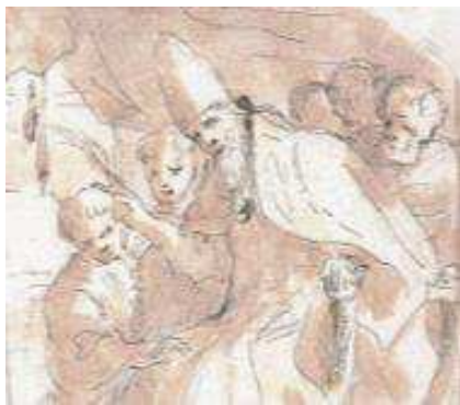
Charles Mellin : Saint-François de Paule aux pieds de Sixte IV. (Détail). MBA Tours

A cette occasion une plaquette Cinquantenaire des Abm vous sera remise.