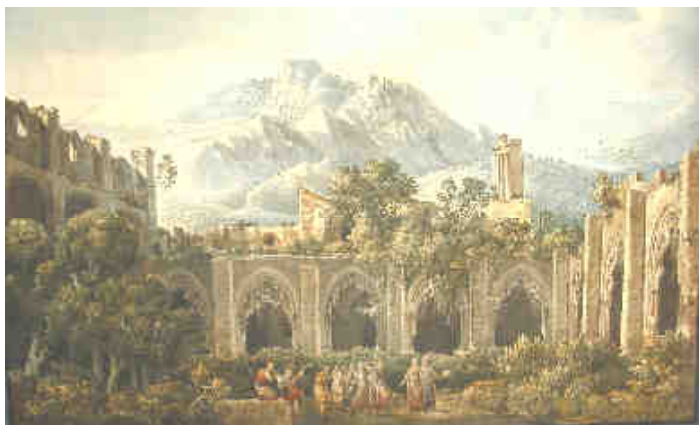
Louis-François Cassas : Vue du cloître de l'abbaye de Bellapais

Disponible dans le cadre de la promotion de l'exposition