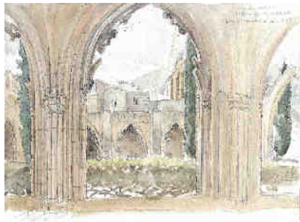
Philippe Delord : BELLAPAÏS Vue du cloître de l'abbaye