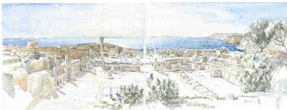
Philippe Delord : KOURION Basilique

Disponible dans le cadre de la promotion de l'exposition