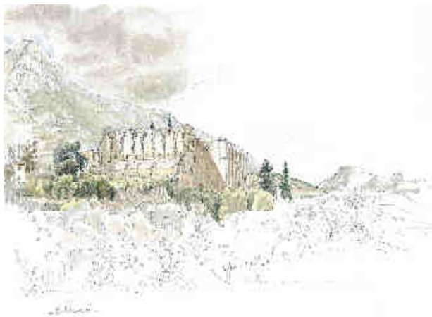
Philippe Delord : BELLAPAÏS Vue générale de l'abbaye