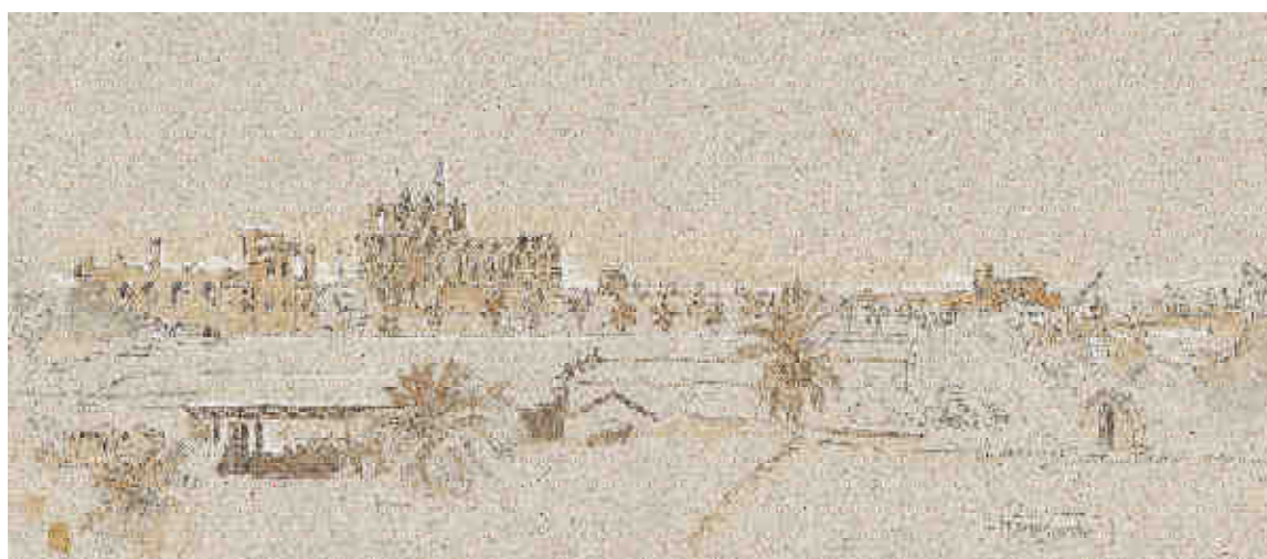
Philippe Delord : Vue générale de Famagouste