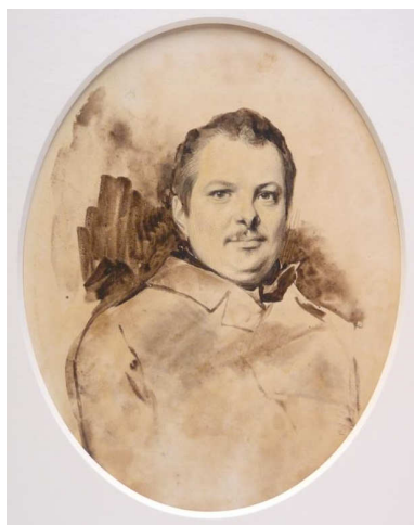
Achille Devéria (1800-1857) Portrait d'Honoré de Balzac , vers 1829 Lavis, sépia et mine de plomb sur papier blanc ; H. 22,8 ; L. 17,4 cm Tours, musée des Beaux-Arts