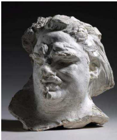
Auguste Rodin (1840-1917) Balzac, tête H (front dégagé et menton fendu) , 1893-1894 Plâtre ; H. 20,2 ; L. 19,5 ; P. 21,5 cm Paris, Musée Rodin