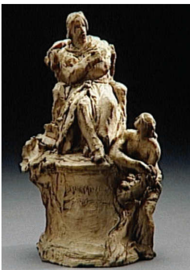
Henri Chapu (1833-1891) Etude pour le monument à Balzac , vers 1889-1890 Terre cuite ; H. 24 ; L. 12,6 ; P. 12,8 cm ; Paris, Musée d'Orsay