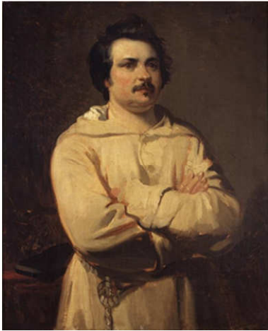
Louis Boulanger (1806-1867) Portrait de Balzac , 1836 Huile sur toile, H. 61 ; L. 50,5 cm Tours, musée des Beaux-Arts