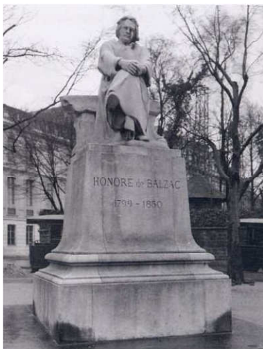
Alexandre Falguière (1831-1900) Monument à Balzac , 1898-1902 Marbre Paris, avenue de Friedland