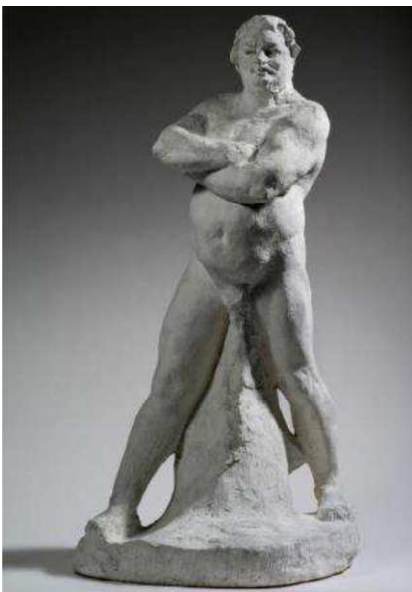
Auguste Rodin (1840-1917) Balzac, étude de nu C, 1892 Plâtre ; H. 128,5 ; L. 52 ; P. 62 cm Paris, Musée Rodin