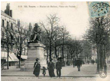
Carte postale représentant le monument à Balzac de Paul Fournier, installé place du Palais en 1889. Tours, Archives municipales