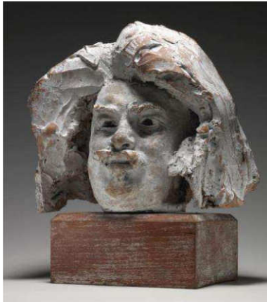
Auguste Rodin (1840-1917) Balzac, étude de tête d'après le conducteur de Tours , 1891-1892 Terre cuite ; H. 28 ; L. 32,7 ; P. 26,9 cm Paris, Musée Rodin