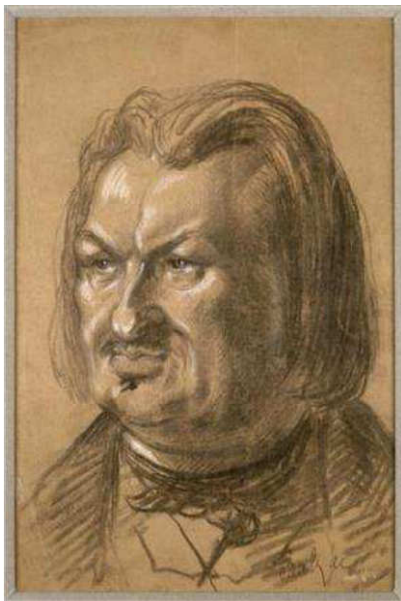
Félix Tournayon, dit Nadar (1820-1910) Balzac, étude pour le Panthéon Nadar , 1850 Fusain et rehauts de gouache blanche sur papier H. 24,5 ; L. 16 cm Paris. Maison de Balzac

A l'occasion de la commémoration du 220 ème anniversaire de la naissance de Balzac, en 2019, la Ville de Tours a initié la création d'une œuvre contemporaine en hommage à Balzac. L'exposition se terminera donc par la présentation de la maquette de l'artiste sélectionné, dont le nom sera connu avant la fin de l'année 2018.