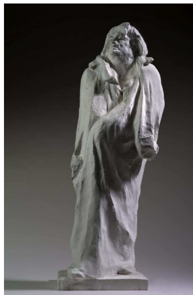
Auguste Rodin (1840-1917) Balzac, étude finale, 1897 Plâtre ; H. 109 ; L. 44 ; P. 41 cm Paris, Musée Rodin