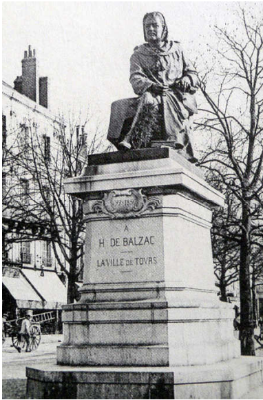
Carte postale représentant le monument à Balzac de Paul Fournier, installé place du Palais à Tours en 1889.

À Tours, la disparition du monument de Paul Fournier, en 1942, donna au sculpteur Marcel Gaumont l'occasion d'imaginer un ambitieux projet d'œuvre de remplacement, qui n'aboutit pas. Aujourd'hui, la Ville de Tours souhaite de nouveau rendre hommage à Balzac par la création d'une œuvre d'art contemporain.