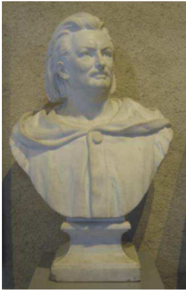
Anatole Marquet de Vasselot (1840-1904) Buste de Balzac , 1876 Marbre ; H. 84 ; L. 57 ; P. 40 cm Saché, Musée Balzac (dépôt du musée des Beaux-Arts de Tours)