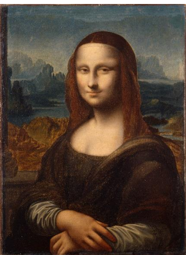
La Joconde Anonyme, Italie, 16 e s. D'après Léonard de Vinci