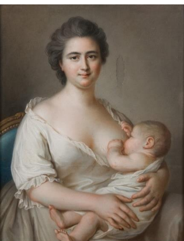
Femme allaitant son enfant François Hubert DROUAIS 2 nd moitié 18 e s.

Cette exposition propose de redécouvrir les collections du musée des Beaux-arts de Tours sous l'angle du portrait, appréhendé sous toutes ses formes. Sur 450 m 2 , l'exposition rassemblera plus de 150 œuvres sorties des réserves, et pour certaines, spécialement restaurées à l'occasion.